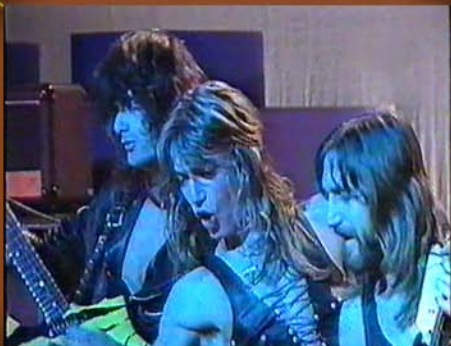
tigres de metal