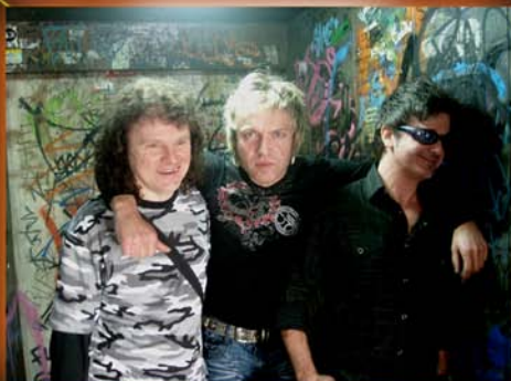
david, achilles, albert