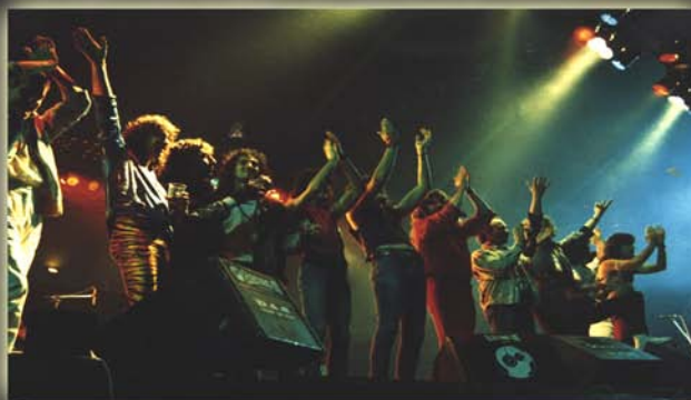
"El heavy no es violencia" Barcelona, Palacio de los deportes de Montjuic 17 de junio de 1987

Paralelamente y con mucho esfuerzo consiguió organizar los festivales bajo el lema "El Heavy no es violencia" en Barcelona, Alicante y Casetas (Zaragoza).